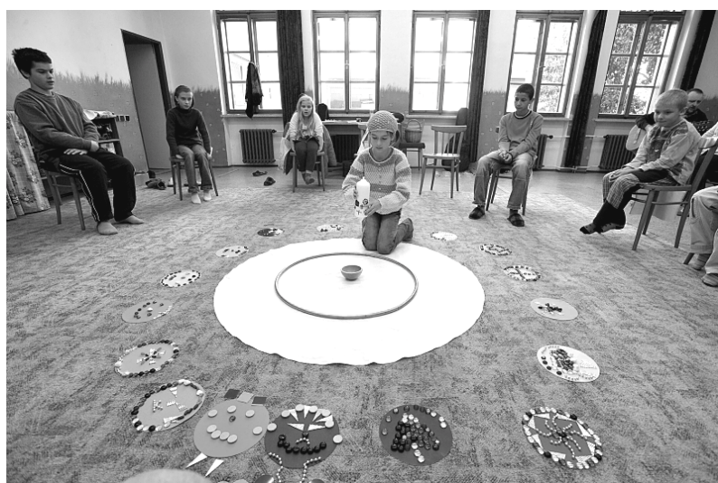
katecheze ve farním sále