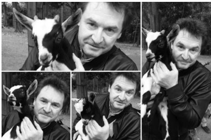
Z výletu prvokomunikantů do ZOO na Svatém Kopečku.

Za oderské farníky Hanka Jakubíková, korekce textu Alena Dratnalová, konečná úprava a fotografie Bára Šindlerová