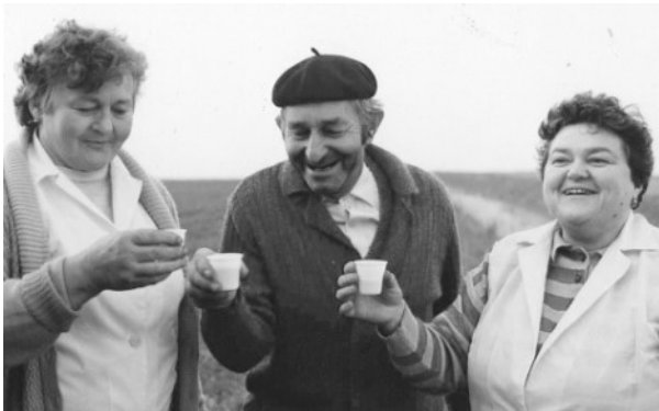
Svěcení kaple Svatého Kříže Dolní Kunčice, 14. 9. 2004