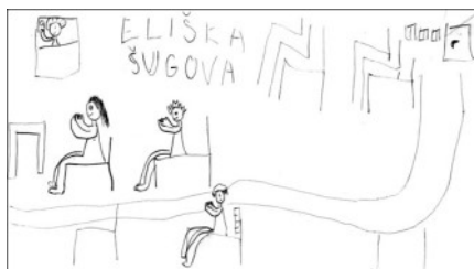
Eliška Schugová, mše svatá na faře