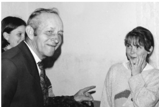
Pohoř, Slavnost Božího Těla, 29. 5. 1997