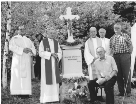
Žehnání kříže cestou na Fulnek, 11. 5. 2000