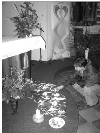
z modlitebního tridua v oderském kostele

5.1., 26.1., 23.2., 8.3., 29.3., 26.4., 24.5., 28.6., 12.7., 2.8., 30.8., 13.9. a 25.10.