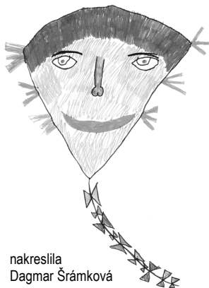
nakreslila Dagmar Šrámková

Dne 2.října na Veselí proběhla akce zvaná DRAKIÁDA. Na této akci se vyskytlo mnoho kupovaných draků, ale i mnoho doma vyrobených draků. Na této akci proběhly 3 úkoly. Nakonec se šlo ke Klézlům, tam se konalo vyhodnocení soutěží a pak opékání párků. Já jsem skončila druhá za doma vyrobeného draka. Zúčastnili se farníci z Oder a okolí. Drakiáda se mi moc líbila.