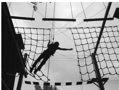
Jana Šušťková zdolávající lanovou překážku ve výšce 6 metrů nad zemí