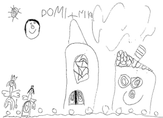
zážitek ze svatomartinského průvodu nakreslila Dominika Jakubíková

Patronem kostela v Tošovicích je sv. Martin. Svátek sv. Martina byl nedávno, to znamená, že v Tošovicích byly hody! Byla nádherná mše svatá, na které byl otec Petr. Při mši sv. děti zpívaly písničky a měly přichystaný příběh o sv. Martinovi.