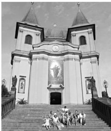
z pouti děvčat na Svatý Hostýn