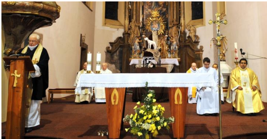
Mše svatá u příležitosti 800 let od narození sv. Anežky České, Odry 2. 2. 2011