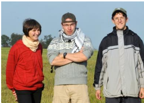
Drakiáda na Veselí, 28. září 2017

Když o se 3 roky později v srpnu 2014 v Odrách otec Michal objevil a k faře začalo postupně najíždět několik osobních aut s jeho knihami, obával jsem se, že budeme muset přistavět k faře další budovu. Velmi záhy se otec Michal pustil do svého díla. Když začal něco dělat, dělal to vždy pořádně a velkoryse . Když rozvážel svou modrou Fábii 6 i 8 dětí po náboženství domů, zůstávaly po něm na faře dveře otevřené a světla rozsvícená. Jarové bublinky po celé kuchyni znamenaly, že otec Michal umýval nádobí. Věci nebylo třeba šetřit, jeho pozornost se neupínala k nim, ale k lidem . Pokud přišla návštěva, všeho nechal a věnoval se jí i několik hodin. Dokázal druhé přesvědčit, že jsou pro něj velmi důležití . Právě toto je ona vášnivá láska k duším , kterou Bůh do jeho duše vložil a která ho tak podivuhodně pobízela k činnosti. Pokud byl před ním zvláště mladý člověk, zcela zapomínal na sebe.