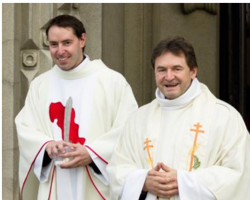
Poutní mše svatá v Tošovicích 11. 11. 2017

At odpočívá v pokoji a náručí milujícího Pána a Spasitele. Vděčný jemu i Pánu Bohu za všechnu službu v naší farnosti.